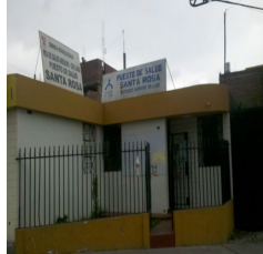
Foto panorámica del EESS y su espacio libre

Nombre del Establecimiento de Salud: P.S. SANTA ROSA Categoría del EESS: I-2 Código RENAES: 7743 Ubicación ( Av. Jr. Pje. Calle): Av. IV Centro Poblado Localidad: Urb. Santa Rosa Distrito: Mariano Melgar Provincia: Arequipa Región: Arequipa Micro Red: Mariano Melgar Red: Arequipa Caylloma Dirección: Arequipa Área geográfica: Urbana Rural: Región geográfica: Costa Sierra: Selva: Área geográfica (Marcar la Rpta. con X): Urbana Región geográfica (Marcar la Rpta. con X): Costa Años de funcionamiento: 18/08/2002