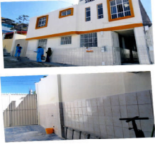
Foto panorámica del EESS y su espacio libre

Nombre del Establecimiento de Salud: PUESTO DE SALUD ATALAYA Categoría del EESS: I-2 Código RENAES: 1308 Ubicación ( Av. Jr. Pje. Calle): CALLE ESPINAR 100 Centro Poblado Localidad: MARIANO MELGAR - PPJJ ATALAYA Distrito: MARIANO MELGAR Provincia: AREQUIPA Región: AREQUIPA Micro Red: MARIANO MELGAR Red: AREQUIPA CAYLLOMA Diresa: AREQUIPA Área geográfica (Marcar la Rpta. con X): Urbana Rural Región geográfica (Marcar la Rpta. con X): Costa Sierra Selva Años de funcionamiento: