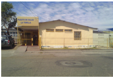
Foto panorámica del EESS y su espacio libre

Nombre del Establecimiento de Salud: PUESTO DE SALUD LA TOMILLA Categoría del EESS I-2 Código RENAES 1244 Ubicación ( Av. Jr. Pje. Calle) Calle Cesar Vallejo s/n Centro Poblado Localidad: La Tomilla Distrito Cayma Provincia Arequipa Región Arequipa Micro Red Francisco Bolognesi Red Arequipa - Caylloma Diresa Arequipa Área geográfica Urbana Rural Región geográfica Costa Sierra Selva Años de funcionamiento: 25 (Marcar la Rpta. con X) X (Marcar la Rpta. con X) X