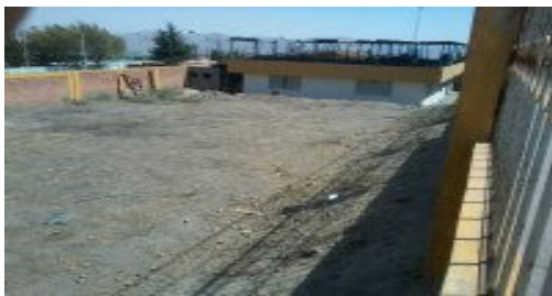
Foto panorámica del EESS y su espacio libre