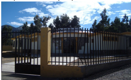
Foto panorámica del EESS y su espacio libre