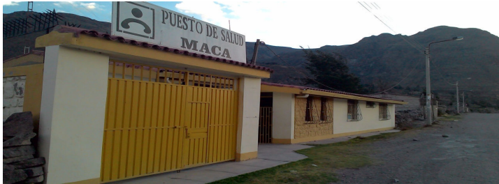
Foto panorámica del EESS y su espacio libre

Nombre del Establecimiento de Salud: PUESTO SALUD MACA Categoría del EESS: I - 1 Código RENAES: 1430 Ubicación ( Av. Jr. Pje. Calle): CARRETERA CABANA CONDE S/N Centro Poblado Localidad: MACA Distrito: MACA Provincia: CAYLLOMA Región: AREQUIPA Micro Red: CHIVAY Red: AREQUIPA CAYLLOMA Diresa: AREQUIPA Área geográfica: Urbana Rural Región geográfica: Costa Sierra Selva Años de funcionamiento: 13 (Marcar la Rpta. con X) X (Marcar la Rpta. con X) X