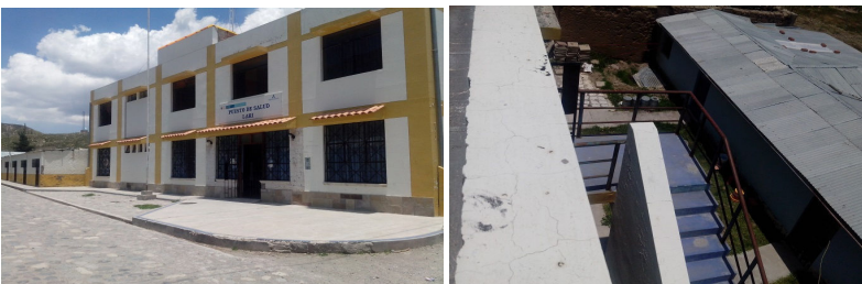
Foto panorámica del EESS y su espacio libre

Nombre del Establecimiento de Salud: PUESTO SALUD LARI Categoría del EESS: I - 2 Código RENAES: 1426 Ubicación ( Av. Jr. Pje. Calle): CALLE AMAZONAS S/N Centro Poblado Localidad: LARI Distrito: LARI Provincia: CAYLLOMA Región: AREQUIPA Micro Red: CHIVAY Red: AREQUIPA CAYLLOMA Diresa: AREQUIPA Área geográfica: Urbana Rural Región geográfica: Costa Sierra Selva Años de funcionamiento: 12 (Marcar la Rpta. con X) X (Marcar la Rpta. con X) X