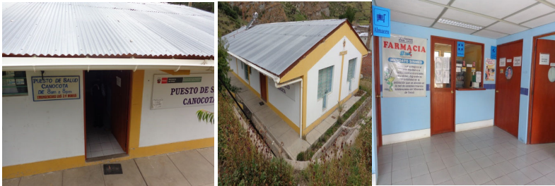
Foto panorámica del EESS y su espacio libre

Nombre del Establecimiento de Salud: PUESTO SALUD CANOCOTA Categoría del EESS I - 1 Código RENAES 1423 Ubicación ( Av. Jr. Pje. Calle) AV. HUAYNALIMA Centro Poblado Localidad: CANOCOTA Distrito CANOCOTA Provincia CAYLLOMA Región AREQUIPA Micro Red CHIVAY Red AREQUIPA CAYLLOMA Diresa AREQUIPA Área geográfica Urbana Rural Región geográfica Costa Sierra Selva Años de funcionamiento: 15 (Marcar la Rpta. con X) X