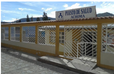
Foto panorámica del EESS y su espacio libre