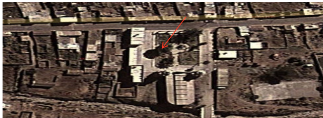
Foto panorámica del EESS y su espacio libre

Características del terreno (Marcar la Rpta con X)