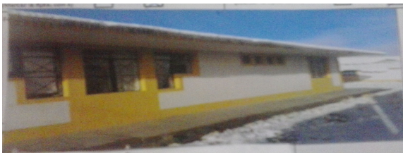
Foto panorámica del EESS y su espacio libre

Nombre del Establecimiento de Salud: PUESTO DE SALUD JACHAÑA Categoría del EESS: I - 2 Código RENAES: Ubicación ( Av. Jr. Pje. Calle): Centro Poblado Localidad: JACHAÑA Distrito: CAYLLOMA Provincia: CAYLLOMA Región: AREQUIPA Micro Red: CAYLLOMA ALTA Red: AREQUIPA - CAYLLOMA Dirección: AREQUIPA Área geográfica: Urbana Rural Región geográfica: Costa Sierra Selva (Marcar la Rpta. con X) X (Marcar la Rpta. con X) X X Años de funcionamiento: 16 AÑOS