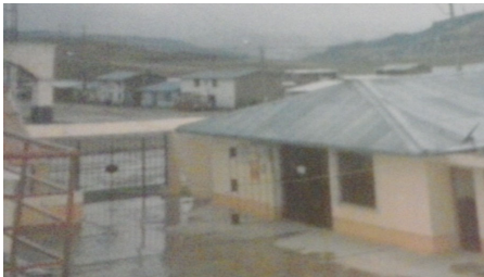
Foto panorámica del EESS y su espacio libre

Nombre del Establecimiento de Salud: PUESTO DE SALUD CAYARANI Categoría del EESS: I - 2 Código RENAES: 1440 Ubicación ( Av. Jr. Pje. Calle): CALL E PRINCIPAL S/N Centro Poblado Localidad: CAYARANI Distrito: CAYARANI Provincia: CONDESUYO Región: AREQUIPA Micro Red: CAYLLOMA ALTA Red: AREQUIPA CAYLLOMA Diresa: AREQUIPA Área geográfica: Urbana Rural Región geográfica: Costa Sierra Selva Años de funcionamiento: 17 AÑOS (Marcar la Rpta. con X) (Marcar la Rpta. con X) (Marcar la Rpta. con X)